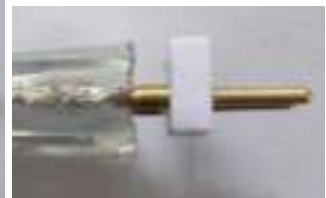
Seitenansicht nach Sicherung des 2-Pin Steckers

Sichern Sie den 2-Pin Stecker zuerst am Streifen. Achten Sie darauf, dass die 2 Stifte fest an den 2 Drähten des Streifens anliegen.