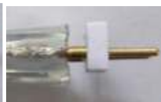
Vista laterale del connettore a 2 perni

Fissare il connettore a 2 perni alla striscia. Prestare attenzione che i due perni aderiscano perfettamente ai fili della striscia