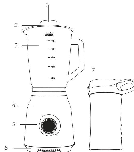
Fig./Img./Abb./Afb./ Rys. 1

Práva duševního vlastnictví k textům v této příručce jsou majetkem společnosti CECOTEC INNOVACIONES, S.L. Všechna práva jsou vyhrazena. Obsah této publikace nesmí být, zčásti nebo jako celek, reprodukován, ukládán do systému obnovy, přenášen nebo distribuován žádnými prostředky (elektronicky, mechanicky, fotokopírováním, nahráváním nebo podobným způsobem) bez předchozího souhlasu společnosti CECOTEC INNOVACIONES, S.L.