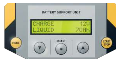
灵敏的操作界面 22种显示语言